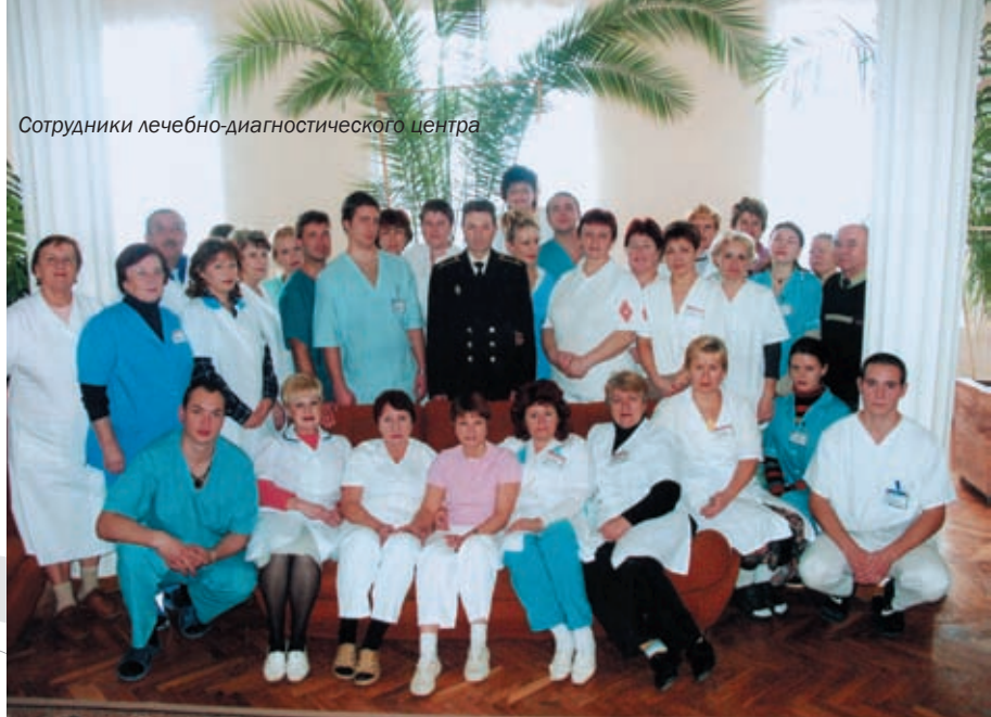
Сотрудники лечебно-диагностического центра