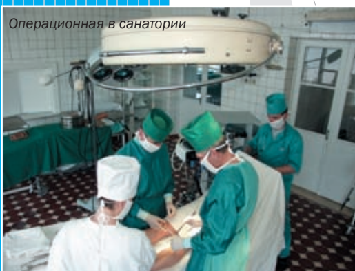
Операционная в санатории